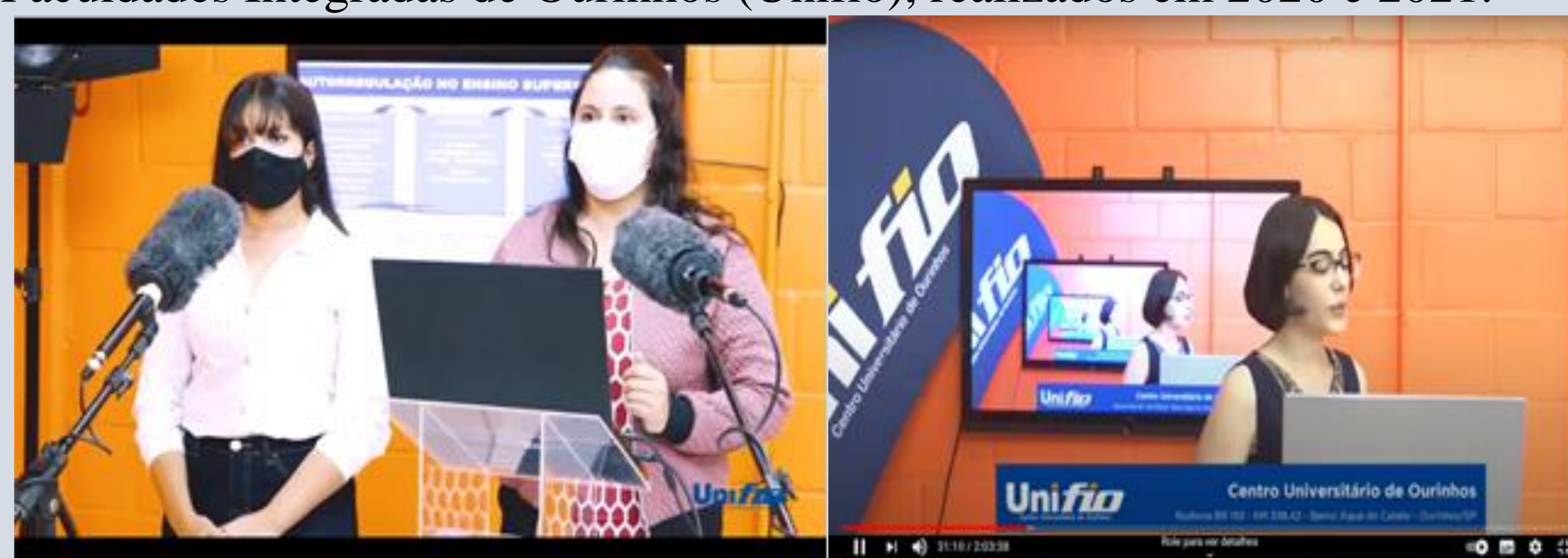
Figura 2 - Vídeos gravados e apresentados por alunos de Farmácia, no IV e V Workshop dos Projetos Integradores do Centro Universitário das Faculdades Integradas de Ourinhos (Unifio), realizados em 2020 e 2021.