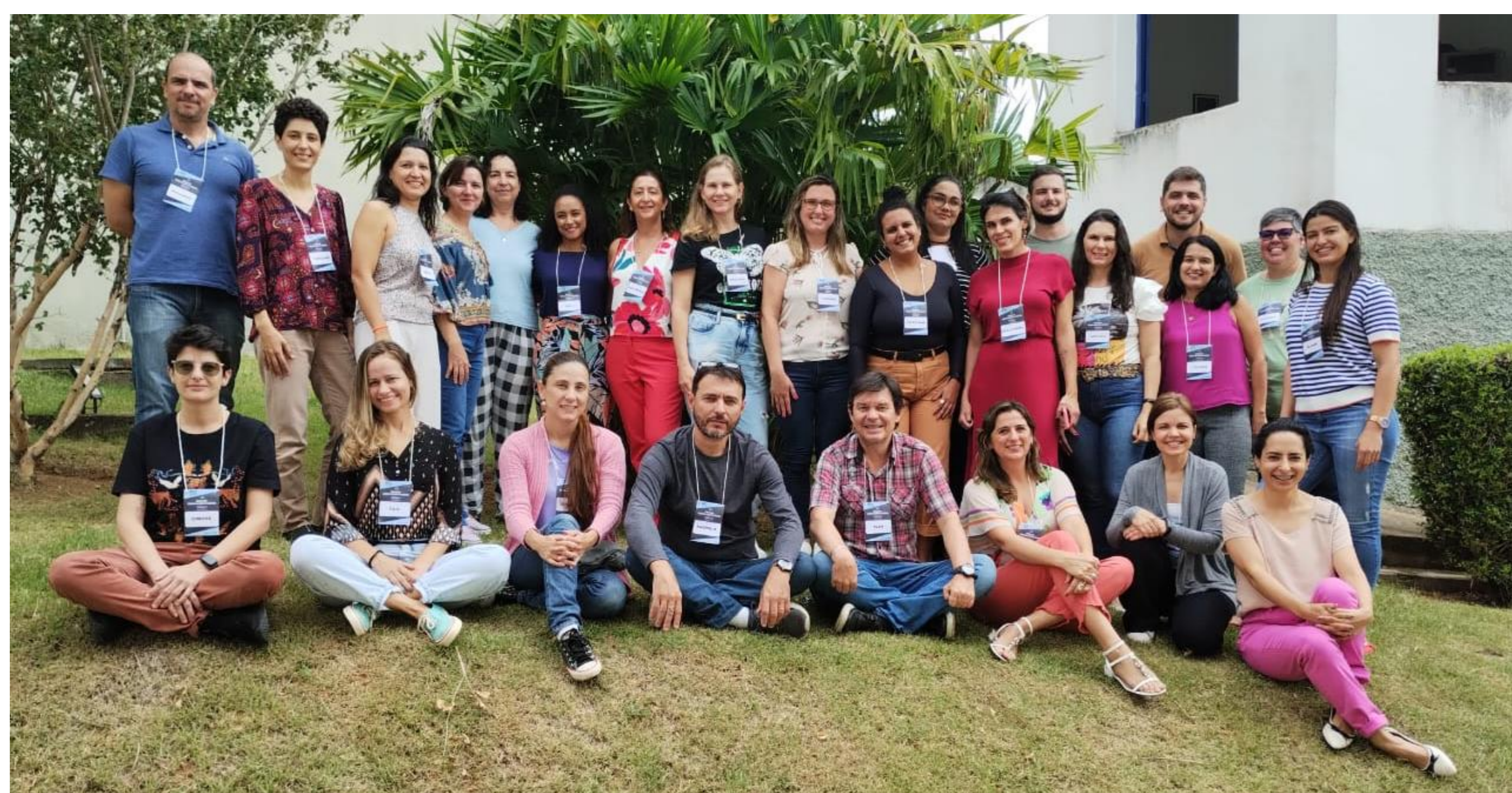
Figura 1: Participantes do curso de Métodos Ativos – Módulo I.

O módulo I versou sobre as temáticas: Métodos Ativos de Ensino, Aprendizagem e Avaliação: Conceitos e Requisitos Importantes; Concepções pedagógicas; Aprendizagem baseadas em filmes; Aula Invertida e Mapa Conceitual. A formação teve a duração de 2 dias e carga horária de 16 h, com participação de 28 docentes universitários de várias áreas do conhecimento.